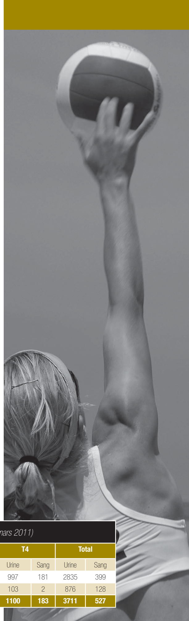
Tableau 1 : Contrôles antidopage par programme (du 1 er avril 2010 au 31 mars 2011)

Pendant l'année, 30 violations des règles antidopage ont été signalées (voir le tableau 2). De ce nombre, 13 révélaient la présence de cannabis et comme le Centre avait averti, ces violations ont commencé à donner lieu à des suspensions et à la publication du nom de l'athlète. De plus, trois sanctions étaient liées à la présence de méthylhexanéamine, un stimulant interdit qui peut se trouver dans certains suppléments amaigrissants. Une sanction de trois ans a été imposée à un athlète dont le prélèvement contenait des hormones de croissance humaine, une première en Amérique du Nord. Le Registre canadien des sanctions antidopage comprend la liste des athlètes canadiens qui ne peuvent pratiquer un sport et cette liste est accessible à www.cces.ca/sanctions .